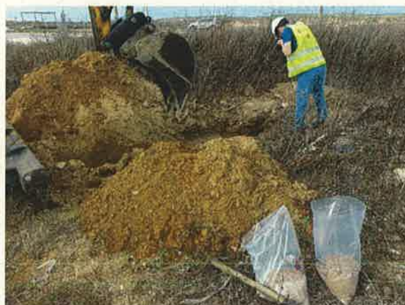
CATA Nº 2 PARCELA 149