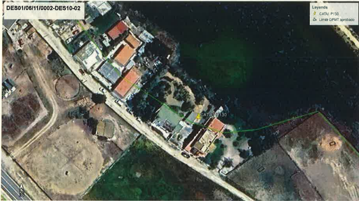
EMPLAZAMIENTO CATA 1 EN PARCELA 130