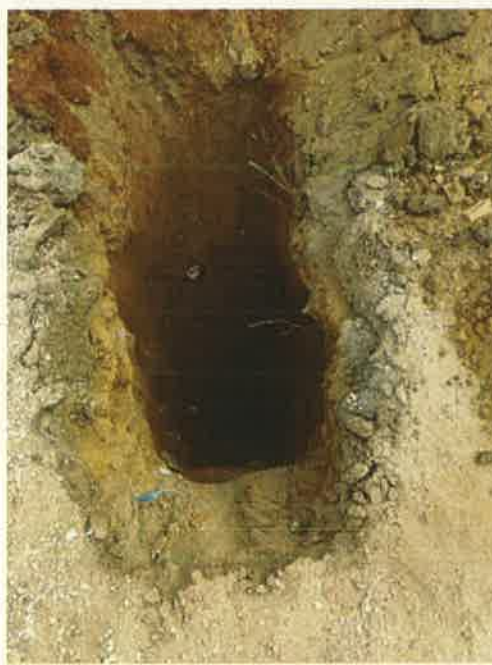
CATA Nº 1 PARCELA 130